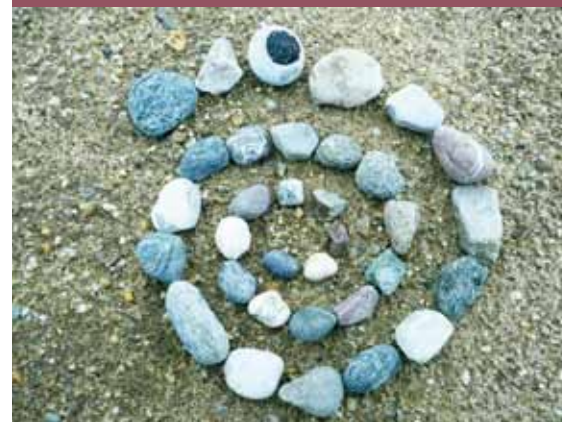
Wege aus der Gewaltspirale

Gottesdienst für Frauen, die (sexualisierte) Ge- walt erfahren haben, und Frauen, die auf unter- schiedliche Weise mit ihnen solidarisch sind